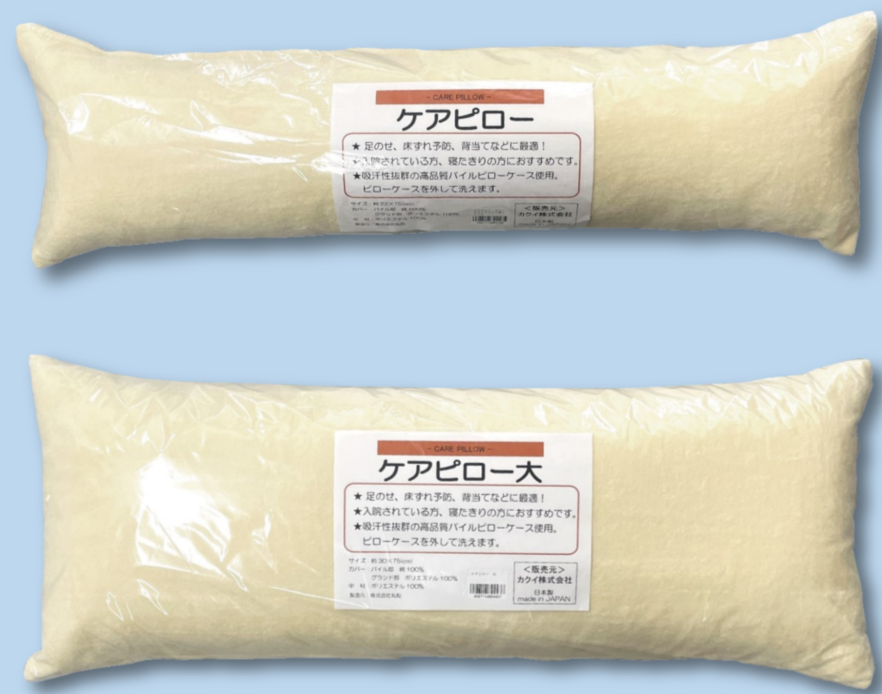
ケアピロー ■販売名：ケアピロー