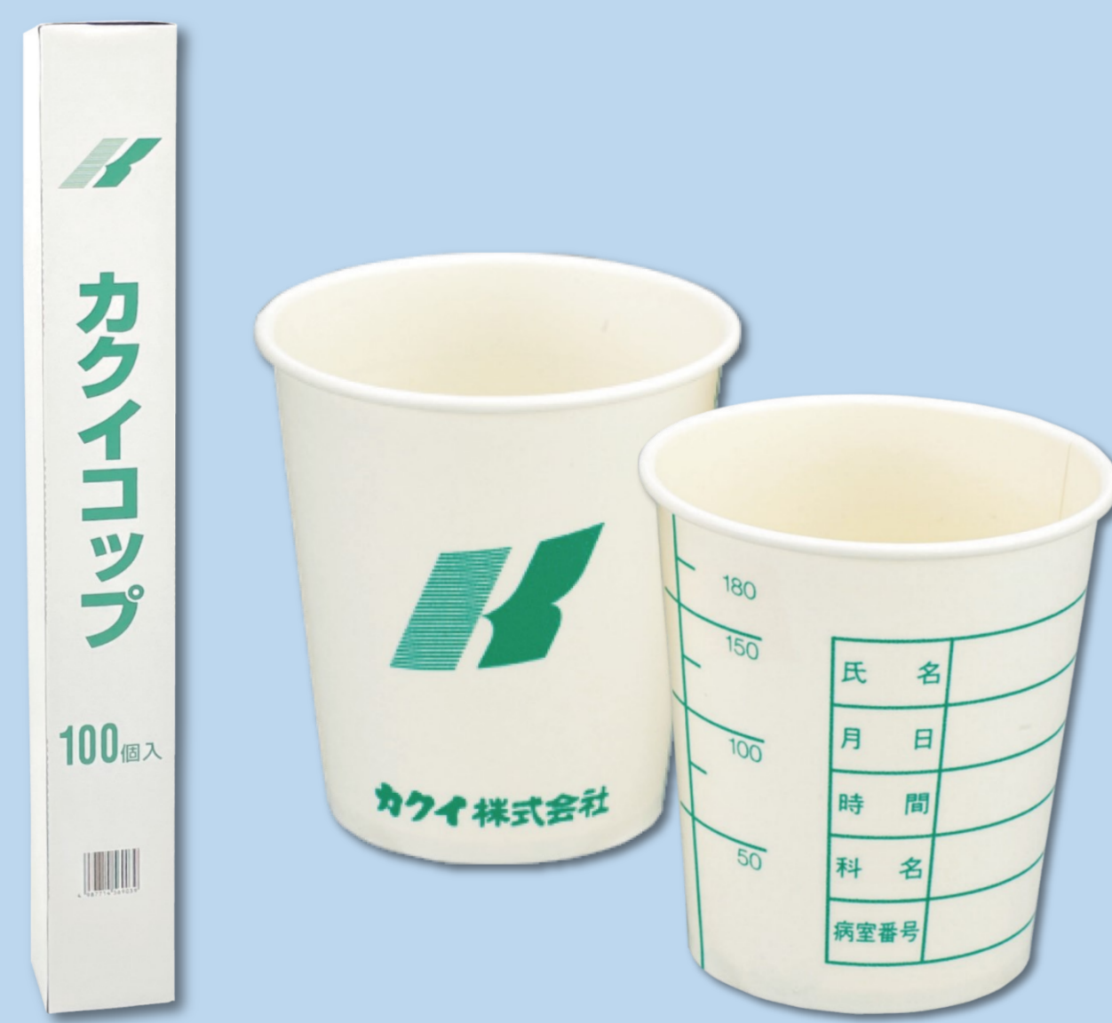
検査用コップ ■販売名：カクイ検査用コップSM-205-3