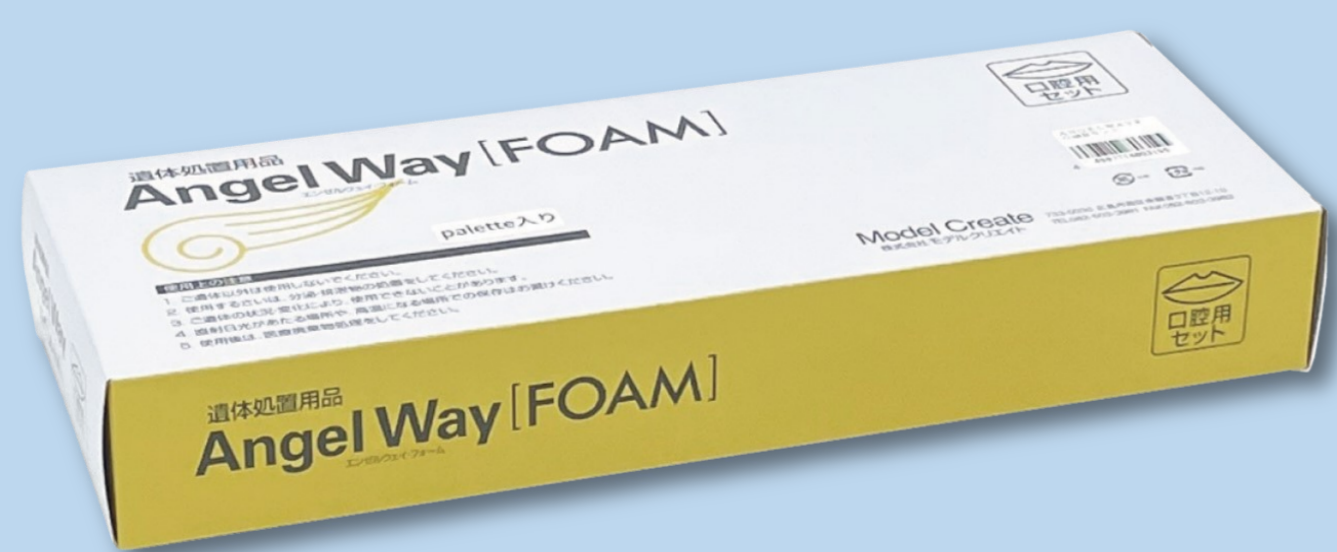
遺体処置用品(口腔用) ■販売名：遺体処置用品 Angel Way[FOAM]