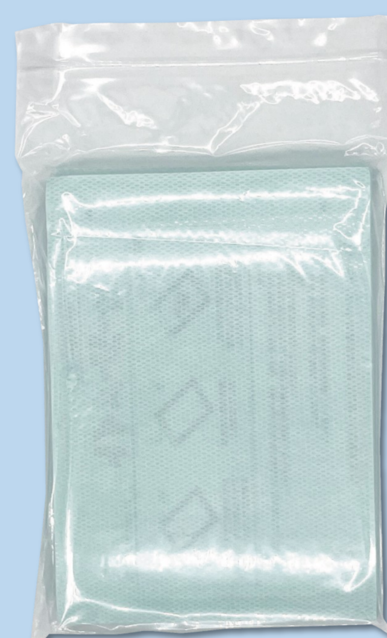
固定用粘着シート ■販売名：フォーシーメイト