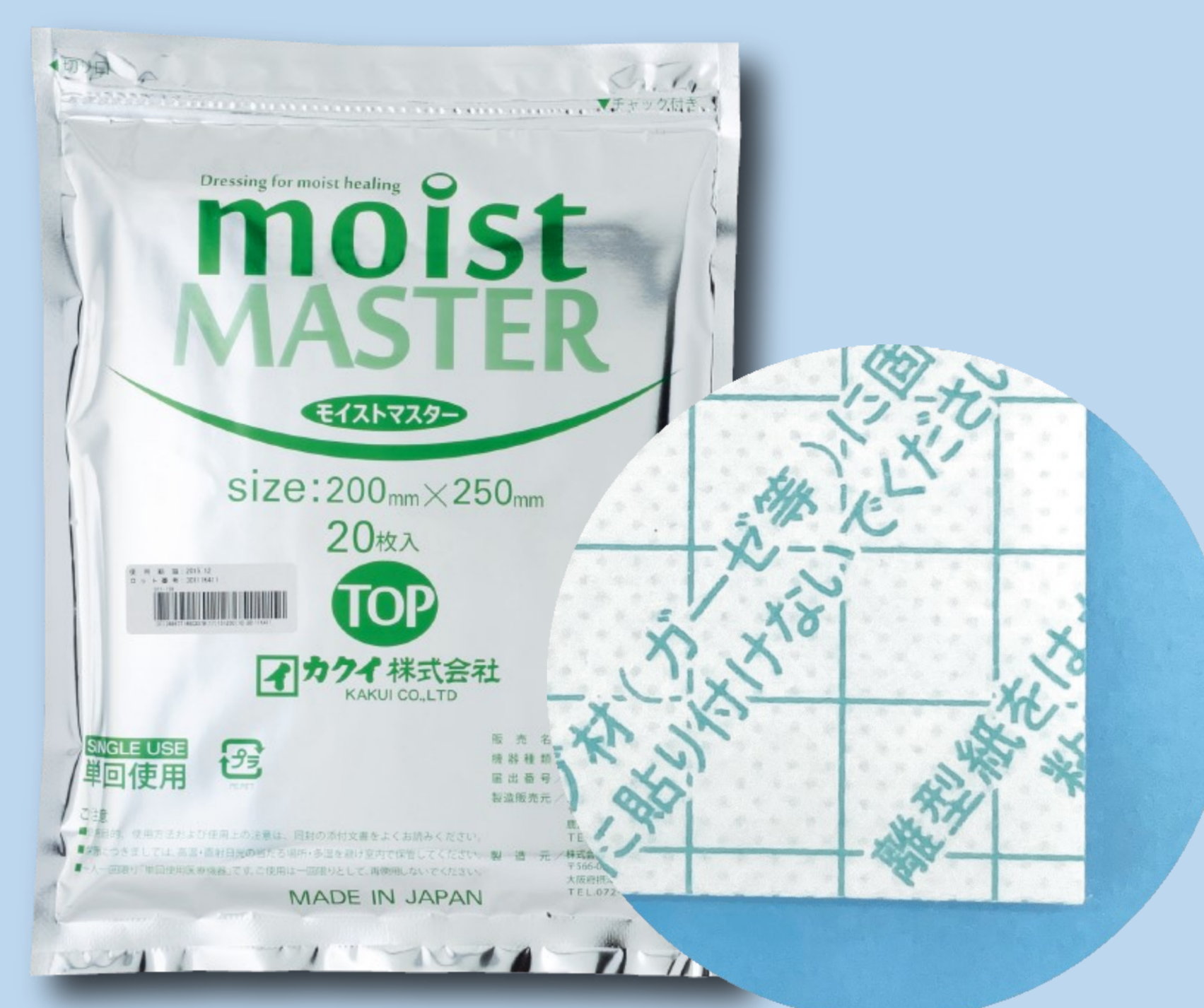
創傷被覆材 モイストマスター ■販売名：モイストマスターV、モイストマスターTOP