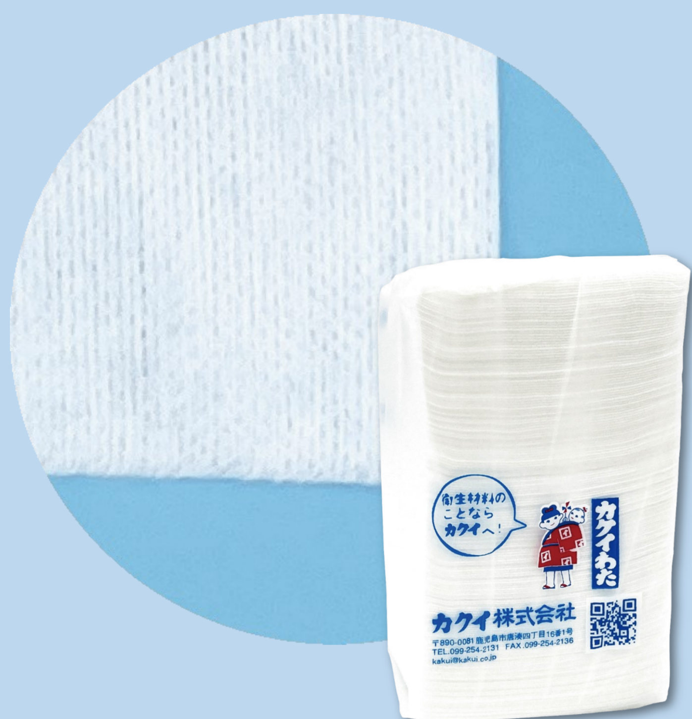
医療用不織布(ポリエステル50% レーヨン50%) ■販売名：カクイディスポガーゼ